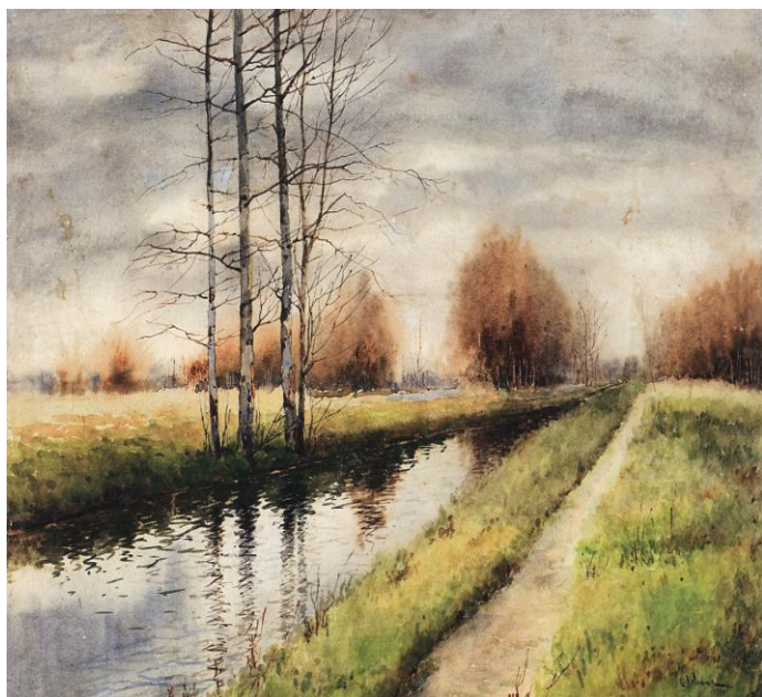
Рисунок 1 "Поздняя осень" И.И. Левитан

"Левитан - это художник, который так ясно, так чистым, таким дивным и полным светом писал о русской природе, что современная молодая его творчеством почти не встречаясь в литературе. И трудно даже встретить критиков, которые, выходя из его произведений, не поддадутся обаянию его редчайшей способности передавать все оттенки, все особенности характерных признаков и черт природы средней полосы России..." (Никонов Б.В.)