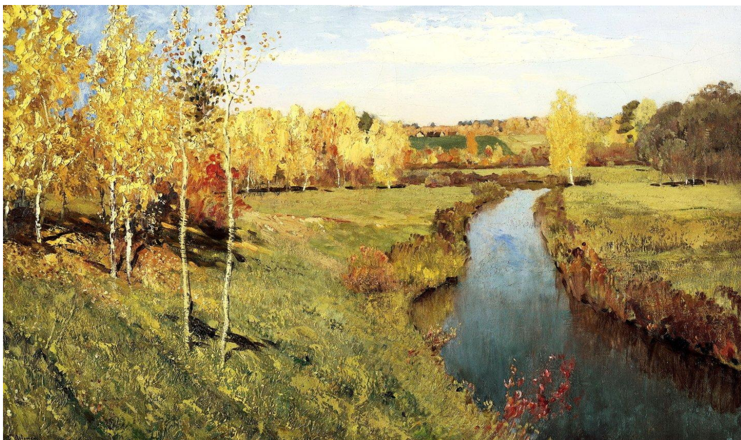
Рисунок 3 "Золотая осень" И.И. Левитан