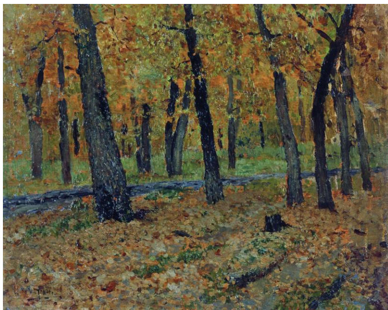
Рисунок 2 "Дубровая роща" И.И. Левитан